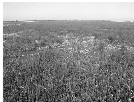
Figura 1: Ejemplo de zona inundada con una alta cobertura de vegetación flotante y emergente.

para definir la categoría de inundado. Usamos para el árbol un valor mínimo de corte de 5, un tamaño mínimo de 10 y una devianza mínima de 0.2.