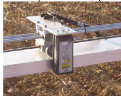
Figura 5: Perfilómetro láser midiendo uno de los campos.

La campaña T-REX tuvo lugar en Agramunt (41°48' N, 1°7' W) del 27 de Noviembre al 2 de diciembre de 2004. Esta campaña está dedicada al análisis del efecto de la rugosidad del terreno en la emisividad, por lo que se realizó en unos campos de experimentación de la Universidad de Lleida (UdLl) y el Institut de Recerca i Tecnologia Agralimentary (IRTA), todos del mismo tipo de terreno. El campo experimental está formado por 4 bloques idénticos, formado cada uno por cuatro parcelas (6m x 50m) recién sembradas (todavía sin plantas) y habiendo aplicado un tipo de laboreo distinto en cada parcela. Cada día se tomaron medidas radiométricas bajo nueve ángulos de incidencia ( \theta , desde 25° a 65°, en pasos de 5°) sobre 8 parcelas, es decir, se tomaban dos medidas de cada tipo de laboreo, y por tanto de la misma rugosidad, diariamente. En esta ocasión el radiómetro y el rack de control para movimiento automático se montaron sobre un remolque que se iba desplazando. Al igual que en MOUSE la medida de la rugosidad de cada campo se obtuvo con el perfilómetro láser (Fig. 5).