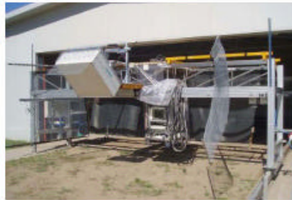
Figura 3: LAURA montado en un caballete deslizante, para tomar medidas en cada campo.

El experimento MOUSE 2004 (MOnitoring UndergrounD Soil Experiment) tuvo lugar en el Joint Research Center (JRC, 45° 48' , 8° 37' E) en Ispra Italia. , desde el 7 de Junio al 1 de julio de 2004. El principal objetivo de este experimento es el estudio de la dependencia de la T_B con respecto del tipo de terreno, del contenido del agua y del ángulo de incidencia.